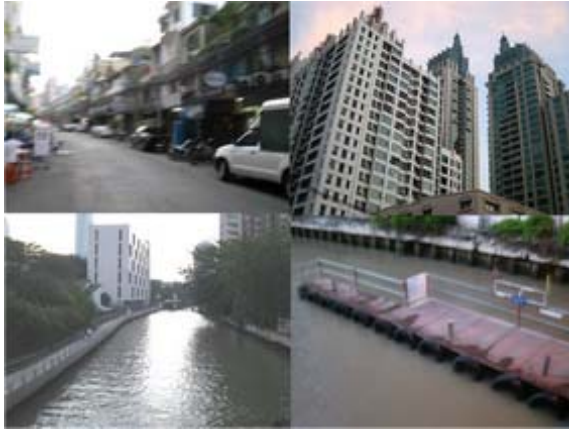
ผมเดินทางสถานีมะกะสัน ผ่านถนนชิดลม และ

ถ่ายรูปตามรายทาง รูปตึกสูงบนถนนชิดลม คลองชิดลม ท่าเทียบเรือโดยสารในคลองชิดลม เป็นรูปบรรยากาศในยามเย็น แล้วกินข้าวมื้อเย็น ก่อนกลับบ้านเตรียมตัวบรรยายที่สมาคมวิชาชีพ (วิศวกรรมสถานแห่งประเทศไทย ในพระบรมราชูปถัมภ์) ในวันรุ่งขึ้น และกลับอุบลราชธานี ในค่ำวันเดียวกันนั้น เรื่องและภาพที่สถานีกรุงเทพ (หัวลำโพง) และบนรถไฟ ไว้ค่อยเล่าในเอ็กไฟล์ตอนต่อไป