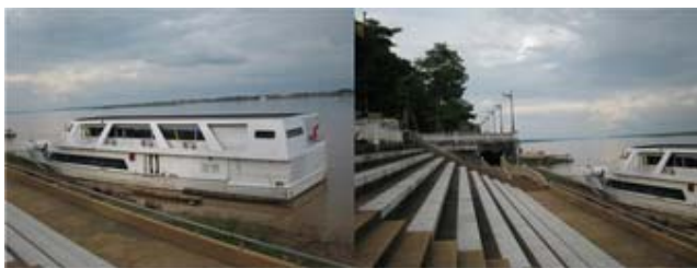
จากซ้าย แวะจังหวัดมุกดาหาร ที่ถนนเลียบ

อุบลราชธานี ผ่านอำนาจเจริญ มุกดาหาร สู่สกลนคร วันนี้ฟ้าเป็นฝน อากาศดี เย็นสบาย ถนนมาตรฐานสูงรถซีความเร็วได้สูง เดินทางได้อย่างสะดวกสบาย ๑ และ ๔ ที่ลานวัด ยังคงเป็นหินภูเขา มีน้ำซับค่อยไหลรินไปรวมกันเป็นลำธาร ไหลตกลงไปสู่เบื้องล่าง ๕ ทางเข้าไปสู่เจดีย์ ๖. เจดีย์องค์ขนาดใหญ่ไม่เกิ่นกำลัง มีผู้บอกว่าสายฟ้า (ฟ้าผ่า) ลงตรงนี้บ่อยมาก ผมคาดว่า คงเพราะมีสายแร่โลหะ เพราะสังเกตเห็นคราบสนิมเหล็กซึมเปื้อนมากับน้ำซับ ได้มีโอกาสขึ้นไปดูส่วนที่จะซ่อมแซมปรับปรุงบนเจดีย์ ทราบว่า เป็นห้องเก็บเครื่องอัฐบริวารของพระอาจารย์มั่น ภูริทัตโต พระเกจิอาจารย์สายวัดป่า เป็นบุญของผมแท้ ๆ ส่วนด้านบน เรือนธาตุ บูด้วยทองคำบริสุทธิ์ ค่ำมหาศาล เป็นที่เก็บพระอรหันต์ธาตุ ๗ มองไปไกลจากบนฐานประตักมณีน เห็นเทือกเขาภูพานทอดเหยียดยาว ๘ ภายหลังเสร็จงาน ทราบว่า พวกเราไม่มีโอกาสจะกราบนมัสการหลวงปู่พระเกจิอาจารย์ เพราะภายหลังเวลาอันเพล เป็นเวลาที่ท่านจะปฏิบัติธรรม ไม่สมควรรบกวนเป็นอย่างยิ่ง ทำได้เพียงนำข้าวกันบาตรมาให้กิน เท่านั้นก็เป็นบุญแล้วละครับ แต่เชื่อไหมว่าก่อนอ่อมอาหารมื้อนี้ หลวงปู่ท่านเดินถือไม้เท้าแกว่งไกว แล้วพูดว่า ไม่ต้องรีบร้อน กินข้าวปลาเสียให้เสร็จ จะไปนั่งรอที่ตรงโน้น แปลว่าวันนั้นก่อนกลับ ผมได้มีโอกาสมากกว่าที่จะได้กราบไหว้หลวงปู่ แต่ได้ฟังท่านเล่าว่า เราอาจมีบุญร่วมกัน ที่ได้มาร่วมกันซ่อมแซมพระเจดีย์เชื่อว่าแรงศรัทธาและผลบุญจะช่วยให้สำเร็จ ฟังแล้วเกิดปีติจนลุก ๙ และ ๑๐ ดอกไม้สวยรอบพระเจดีย์ ๑๑ และ ๑๒ เฟิร์น ตะไคร่น้ำ ฟองหิน และฝอยลม พืชชั้นต่ำบนลาน และชอกหินริมทางเดิน บ่งบอกความสมบูรณ์ของพืชพรรณในป่าดิบ และเบญจพรรณ