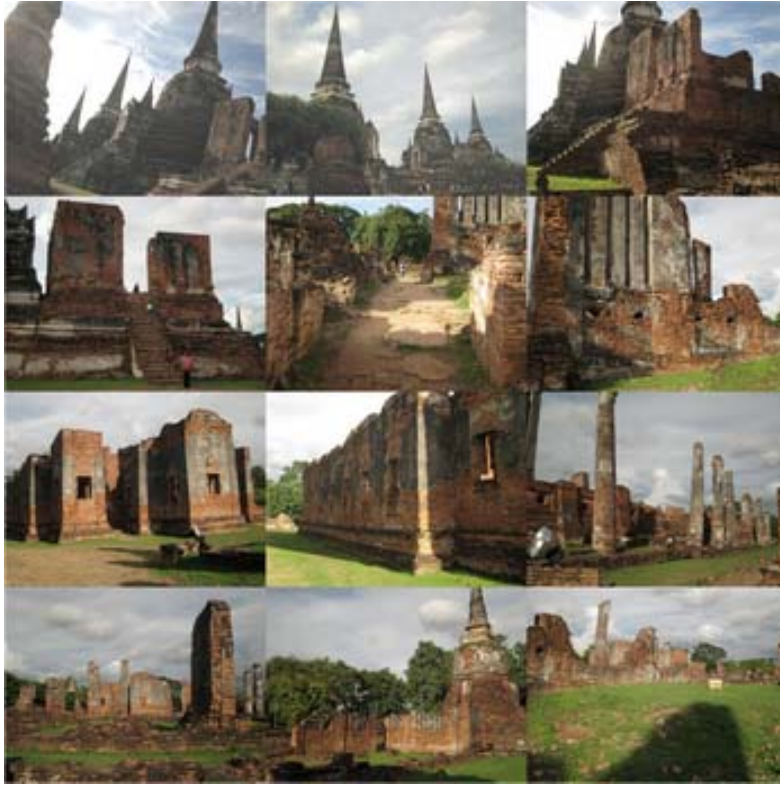
ซ้ายไปขวา บนลงล่าง ๑-๒

พระสถูปเจดีย์ องค์ตะวันออก บรรจุพระอัฐิของสมเด็จพระบรมไตรโลกนาถ (สร้างเมื่อ พ. ศ. ๒๐๓๕) องค์กลาง บรรจุพระอัฐิของสมเด็จพระบรมราชาที่ ๓ (พ. ศ. ๒๐๔๒) เจดีย์องค์ที่ ๓ ด้านทิศตะวันตกบรรจุพระอัฐิของสมเด็จพระบรมราชาที่ ๒ (เจ้าสามพระยา) สถูปเจดีย์ทั้งสามนี้ อาจกล่าวได้ว่า เป็นสัญลักษณ์ของแหล่งประวัติศาสตร์ และโบราณสถานแห่งกรุงศรีอยุธยา และขณะนี้ เชื่อว่าท่านคงหายสงสัยแล้วว่า เป็นเจดีย์อะไร ผู้ใดสร้าง แต่ท่านคงจำไม่ได้หรือ ๓ และ ๔ ระหว่างสถูปเจดีย์แต่ละองค์ แต่ด้านริม มีโครงสร้างมณฑป แต่ส่วนใหญ่พังทลายเสียหายไป ๕ ถึง ๑๒ ภายในวัดพระศรีสรรเพชญ์ ระหว่างทางที่จะเดินไปสู่เขตพระราชวังเดิม ปรากฏสิ่งปลูกสร้างปรักหักพังมากมาย ที่น่าสนใจคือเสากลม ก่อประสานด้วยอิฐร่องรอยปูนฉาบ ฐานปูนปั้นรูปกลีบดอกบัว ซึ่งเป็นแบบเดียวกับที่พบในสิ่งปลูกสร้างยุคสุโขทัยที่อุทยานประวัติศาสตร์รามคำแหง ช่องแสง และช่องระบายอากาศ ซึ่งเหมือนกับที่วิหารวัดนางพญา อุทยานประวัติศาสตร์ศรีสัชนาลัย