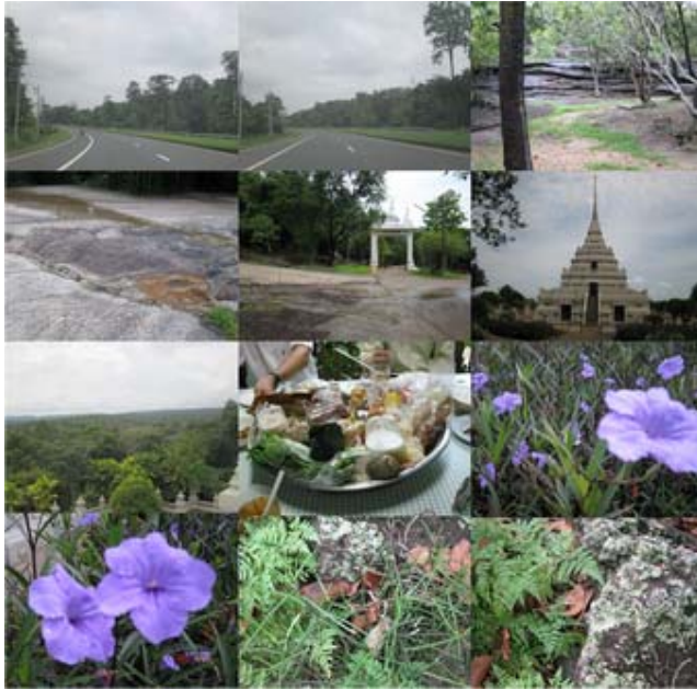
ซ้ายไปขวา บนลงล่าง ๑ และ ๒ ถนนจาก

อุบลราชธานี ผ่านอำนาจเจริญ มุกดาหาร สู่สกลนคร วันนี้ฟ้าเป็นฝน อากาศดี เย็นสบาย ถนนมาตรฐานสูงรถซีความเร็วได้สูง เดินทางได้อย่างสะดวกสบาย ๑ และ ๔ ที่ลานวัด ยังคงเป็นหินภูเขา มีน้ำซับค่อยไหลรินไปรวมกันเป็นลำธาร ไหลตกลงไปสู่เบื้องล่าง ๕ ทางเข้าไปสู่เจดีย์ ๖. เจดีย์องค์ขนาดใหญ่ไม่เกิ่นกำลัง มีผู้บอกว่าสายฟ้า (ฟ้าผ่า) ลงตรงนี้บ่อยมาก ผมคาดว่า คงเพราะมีสายแร่โลหะ เพราะสังเกตเห็นคราบสนิมเหล็กซึมเปื้อนมากับน้ำซับ ได้มีโอกาสขึ้นไปดูส่วนที่จะซ่อมแซมปรับปรุงบนเจดีย์ ทราบว่า เป็นห้องเก็บเครื่องอัฐบริวารของพระอาจารย์มั่น ภูริทัตโต พระเกจิอาจารย์สายวัดป่า เป็นบุญของผมแท้ ๆ ส่วนด้านบน เรือนธาตุ บูด้วยทองคำบริสุทธิ์ ค่ำมหาศาล เป็นที่เก็บพระอรหันต์ธาตุ ๗ มองไปไกลจากบนฐานประตักมณีน เห็นเทือกเขาภูพานทอดเหยียดยาว ๘ ภายหลังเสร็จงาน ทราบว่า พวกเราไม่มีโอกาสจะกราบนมัสการหลวงปู่พระเกจิอาจารย์ เพราะภายหลังเวลาอันเพล เป็นเวลาที่ท่านจะปฏิบัติธรรม ไม่สมควรรบกวนเป็นอย่างยิ่ง ทำได้เพียงนำข้าวกันบาตรมาให้กิน เท่านั้นก็เป็นบุญแล้วละครับ แต่เชื่อไหมว่าก่อนอ่อมอาหารมื้อนี้ หลวงปู่ท่านเดินถือไม้เท้าแกว่งไกว แล้วพูดว่า ไม่ต้องรีบร้อน กินข้าวปลาเสียให้เสร็จ จะไปนั่งรอที่ตรงโน้น แปลว่าวันนั้นก่อนกลับ ผมได้มีโอกาสมากกว่าที่จะได้กราบไหว้หลวงปู่ แต่ได้ฟังท่านเล่าว่า เราอาจมีบุญร่วมกัน ที่ได้มาร่วมกันซ่อมแซมพระเจดีย์เชื่อว่าแรงศรัทธาและผลบุญจะช่วยให้สำเร็จ ฟังแล้วเกิดปีติจนลุก ๙ และ ๑๐ ดอกไม้สวยรอบพระเจดีย์ ๑๑ และ ๑๒ เฟิร์น ตะไคร่น้ำ ฟองหิน และฝอยลม พืชชั้นต่ำบนลาน และชอกหินริมทางเดิน บ่งบอกความสมบูรณ์ของพืชพรรณในป่าดิบ และเบญจพรรณ