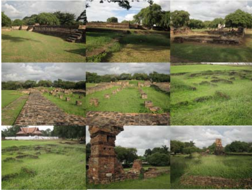
ซ้ายไปขวา บนลงล่าง

เช่นกัน แต่พระบาทสมเด็จพระจุลจอมเกล้าเจ้าอยู่หัว ทรงโปรดฯให้สร้างพลับพลาขึ้นที่บริเวณดังกล่าวในปีพ.ศ. ๒๔๕๑ เพื่อบวงสรวงบูรพกษัตริย์ เมื่อคราวทรงครองราชย์ครบ ๔๐ ปี