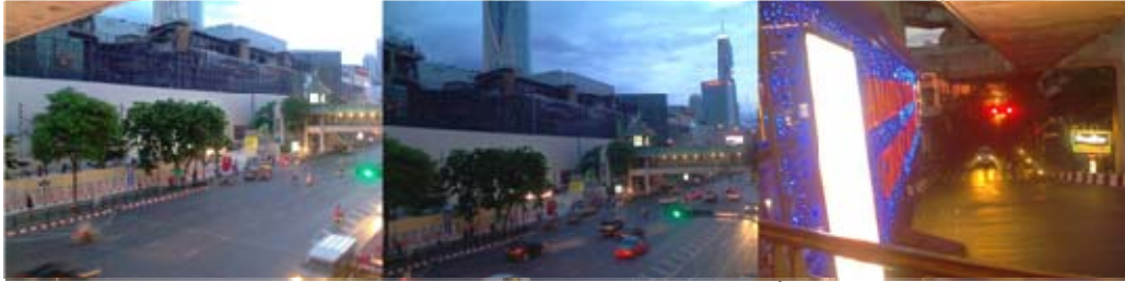
รูปแยกราชประสงค์ ห้างหายไปนานสองสามเดือน วันนี้ไม่เหมือนเดิม