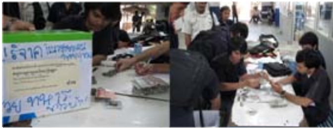
๒๓ กุมภาพันธ์ ๑๒๕๕๔ นับเงิน และ

เหตุไม่สงบที่ชายแดน มีผลโดยตรงต่อนักศึกษาหลายคนที่มีภูมิลำเนา อยู่ที่ชายแดน อาจารย์ และ นักศึกษาหลายคนรวบรวมเงินและสิ่งของ ช่วยเหลือทั้งชาวบ้านที่อพยพโดยไม่ได้เตรียมตัว และส่งให้ทหาร ที่ ปฏิบัติหน้าที่ ประชาชนหลายกลุ่ม รวมตัวกันตั้งศูนย์ประสานงานช่วยเหลือ ทั้งแจกจ่ายสิ่งของ และส่งอาหาร ขึ้นไปให้ทหาร ทั้งที่ไม่ได้มีการจัดตั้งกันเป็นเรื่องราว แต่อาจเพราะทุกคนเห็นแก่เพื่อร่วมชาติ และสำนึกใน ความเป็นชาติ ที่ควรลืมเรื่องราวบาดหมาง หรือทุกข์ร้อนของแต่ละคนชั่วขณะ รองอธิการบดี ๆ ด้กรุณาจัดรถ โดยสาร พานักศึกษาเหล่านี้ และนักศึกษาคณะอื่น ๆ ไปส่งเงินและข้าวของ และไปดูให้เห็นกับตาว่า ความ เดือดร้อนทุกหย่อมหญ้าประเทศไทย จะดับได้ด้วยคนไทย เราคงหวังอะไรกับคนรุ่นเก่าไม่ได้เสียแล้ว ต้อง ปลอຍให้พาดพิงกันบรรลัยไปเสียทุกฝ่ายกระมัง ผมขอร้องให้อาจารย์ท่านหนึ่ง พานักศึกษาสองราย ซึ่งได้รับ ทุนพระราชทานฯ ไปเฝ้ารับเสด็จ ที่โรงเรียนตำรวจตระเวนชายแดน ท่ามกลางเสียงปึงดังต่อเนื่องอยู่หลาย วัน จึงค่อยสงบลง คนที่มีอายุอานามทันเหตุการณ์สงครามชายแดน จะไม่รู้ลึกรู้สา กับเหตุการณ์นี้เลย แต่ก็คง ไม่อยากให้เกิด