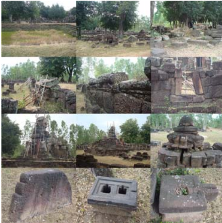
(ซ้ายไปขวา บนลงล่าง) ๑

หากเดินทางจากอำเภอเกษตรวิสัยมาภูโพนระฆัง ใช้ทางหลวงแผ่นดินหมายเลข ๒๑๔ มุ่งทิศตะวันออกเฉียงใต้ ๑๐ กิโลเมตร เลี้ยวขวาตามทางหมายเลข ๔๐๖๒ (ผ่านบ้านโพนโพธิ์ บ้านม่วง) ประมาณ ๗ กิโลเมตรก็จะถึงบ้านกู่กาสิงห์ ภูโพนระฆังตั้งอยู่ชายหมู่บ้านทางด้านทิศตะวันออกเฉียงใต้ กรมศิลปากรประกาศขึ้นทะเบียนโบราณสถานในราชกิจจานุเบกษา เล่ม ๙๙ ตอนที่ ๑๗๒ (ฉบับพิเศษ) หน้า ๒๖ ลงวันที่ ๑๙ พฤศจิกายน พุทธศักราช ๒๕๒๕ โดยกำหนดขอบเขตพื้นที่โบราณสถานไว้ประมาณ ๒ ไร่ ๓ งาน ๑๗ ตารางวา ภูโพนระฆัง ถูกขุดแต่งทางโบราณคดีเมื่อปีพุทธศักราช ๒๕๔๕ โดยสำนักงานศิลปากรที่ ๑๑ อุบลราชธานี (สำนักงานโบราณคดีและพิพิธภัณฑสถานแห่งชาติที่ ๘ อุบลราชธานี ในขณะนั้น) ใช้งบประมาณจากการท่องเที่ยวแห่งประเทศไทยเพื่อขุดแต่งและเขียนแบบภูโพนวิท และภูโพนระฆัง ๑,๕๐๐,๐๐๐ บาท