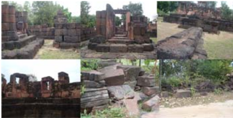
(ซ้ายไปขวา บนลงล่าง)

๑ และ ๒ สิ่งปลูกสร้างภายหลังบูรณะ กลับคืนสู่สภาพดีที่สุดในเท่าที่จะทำได้ ๓ บางอย่างเหลือเพียงร่องรอย คือซากฐาน ๔ กรอบบานประตู ทำให้สามารถติดตั้งทับหลังกลับที่เดิมได้ ๕ และ ๖ หินที่เหลือจากการเรียงกลับ