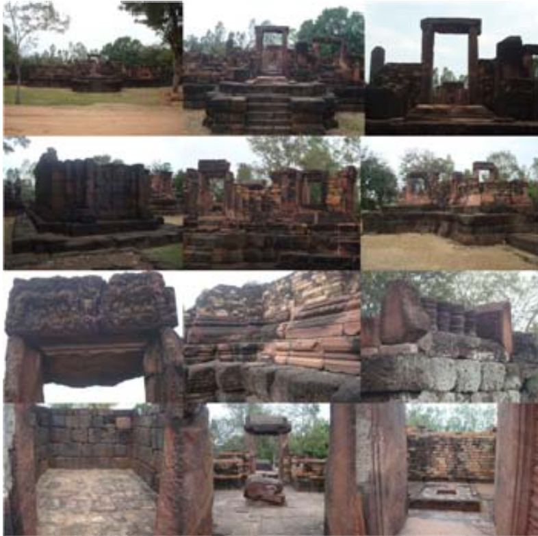
(ซ้ายไปขวา บนลงล่าง)

คือหาที่ปะติดปะต่อไม่ได้ กองเก็บไว้ วันหนึ่ง อาจมีคนเก่งกลับมาเรียงใหม่ จนได้โบราณสถานที่สมบูรณ์กว่านี้ ใครจะไปรู้