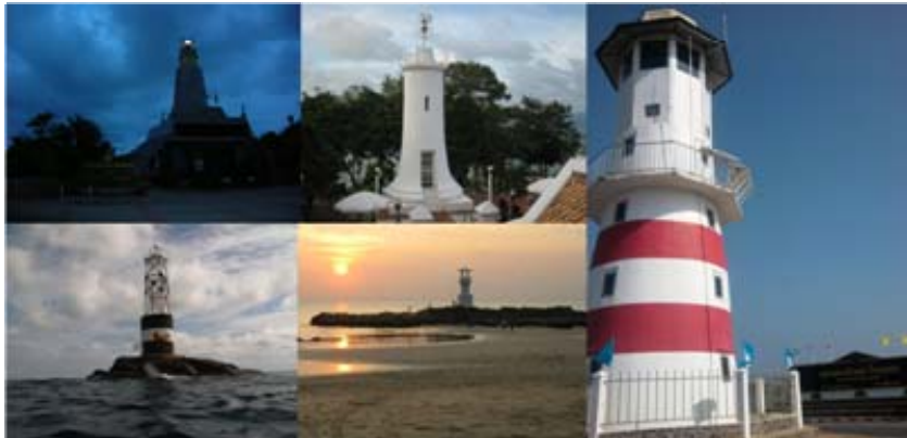
รูปประกาศารครับ

ผมกำลังสะสม เพราะดูแล้วมันแว้งแว้ง โดดเดี่ยวดี ซ้ายไปขวา ๑ ประกาศารกาญจนานิกิเชก แหลมพรหมเทพ ภูเก็ต ๒ ประกาศารเขาตังกวน สงขลา ๓ ประกาศารเกาะโลซิน ปัตตานี (โดยพิชาญ โรจนรัตน์ศิริกุล) ๔ ประกาศารที่เกาะหลัก (ชื่ออะไรก็ไม่รู้ ถ่ายโดยพิชาญ โรจนรัตน์ศิริกุล) และรูปใหญ่ ประกาศารแหลมแม่ ตราด “สุดแผ่นดินตะวันออก” (โดยพิชาญ โรจนรัตน์ศิริกุล)