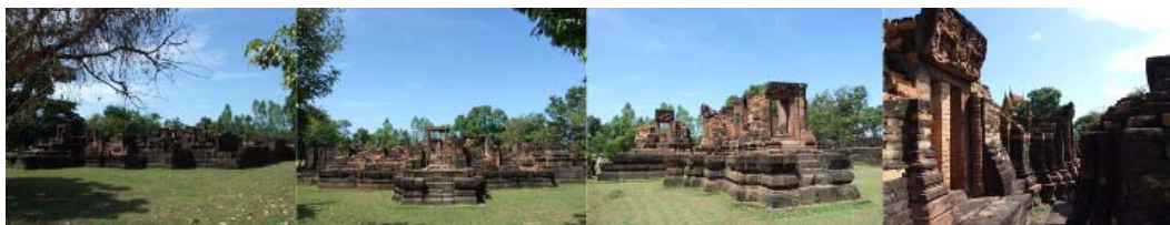
กูกาสิ่งห์ ร้อยเอ็ด- จากพีระพล ศรีกุลวงศ์ ถ่ายส่งไปให้ตั้งนานแล้ว สืมเสียได้

๑ ภาพจากมุมไกล ๒ และ ๓ บันไดขึ้นฐานหินแลง และบานประตู (โคปุระ) ตรงนี้ หากเป็นปราสาทขนาดใหญ่ หรือมีความซับซ้อน ก็คงจะเป็นจุดสิ้นสุดของสะพานนาคราช มีสิ่งห่อหุ้มหนึ่งนึ่งแผ่ทางขึ้น และประตู นัยว่าแบ่งเขตระหว่างโลก และสวรรค์ ๔ ถึง ๖ สิ่งปลูกสร้าง ภายในอาณาบริเวณ (ปราสาทประธาน ปราสาทอีกสององค์ และบรรณาลัย) ๗ ทับหลังชั้นสำคัญ สลักเป็นภาพพระอินทร์ทรงช้างเอราวัณในชุมเรือนแก้ว โดยยืนอยู่เหนือหน้าภาพ ซึ่งใช้มียึดจับก่อนพวงมาลัยอีกทีหนึ่ง คือสิ่งหนึ่งซึ่งบ่งบอกความเป็นศาสนสถาน หรือเทวสถาน และลัทธิไศวนิกาย สามารถสันนิษฐานยุคสมัยของโบราณสถานแห่งนี้ได้อย่างมั่นใจ และรู้ที่มาของชื่อ กูกาสิ่งห์ ๘ ฐานของปราสาท บนฐานแลง อีกชั้นหนึ่ง ซึ่งเป็นแบบอย่างปราสาทขอมทั่วไป ๙ กรอบช่องแสง และลูกกรงลูกมะหวด ที่ติดตั้งอยู่กับโบราณสถาน (ยังมีอีกจำนวนมากที่เก็บรักษาไว้ในโรงเก็บ เพราะหาที่ติดตั้งไม่ได้ หรือไม่อยู่ในวิสัยที่จะติดตั้ง เช่น ผนังด้านนั้นหายไป) ๑๐ โถงโล่งในปราสาทประธาน คือห้องครรภคฤหะ ก็เป็นได้ ๑๑ รูปโคหมอบ หรือเป็นโคนนทิ พาหนะของพระอิศวร และ ๑๒ ฐานโยนี