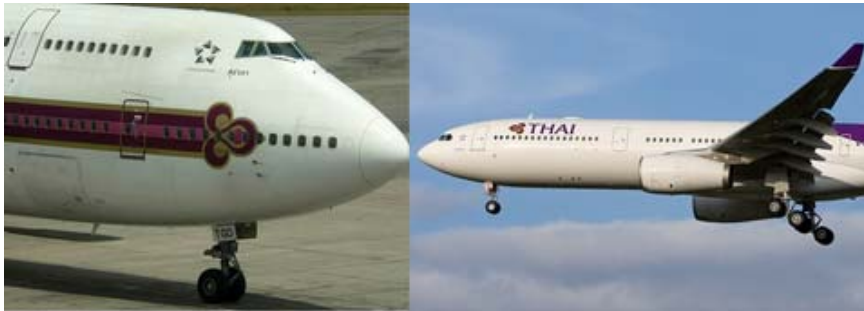
จากอากาศยาน

ผมอ่านข่าว อากาศยาน A330-343X ทะเบียน F-WWKK ลวดลายไทยเห็นฟ้าเหนือเมือง Toulouse ซึ่งเป็นถิ่นฐานการต่ออากาศยาน Airbus ทราบว่าเมื่อส่งมอบแล้ว เธอจะขึ้นทะเบียนเป็น HS-TEN และสวมนามพระราชทาน “สุชาดา” (Suchada) เช่นนั้นก็ต้องแปลว่าอากาศยาน Boeing 747-3D7 ทะเบียน HS-TGD นามพระราชทาน “สุชาดา” ก็คงถึงคราวปลดประจำการ เป็นเวลาที่อากาศยาน Boeing 747-300 ทุกลำจะหมดไปจากฝูงบิน และคุณแนวโน้มอากาศยานรุ่นใหม่ ๆ หากมิใช่ Boeing 777 ก็จะเป็น A330 หรือรอเวลาส่งมอบ A380 แปลว่า เป็นไปได้ที่อนาคต อากาศยานราชีนีแห่งท้องฟ้า Boeing 747 อาจหมดไปจากฝูงบิน เพราะขนาดความจุ และความสิ้นเปลืองของเธออยู่ระหว่าง อากาศยานทั้งสามรุ่นที่กล่าวมา