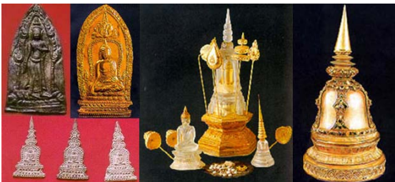
พระพิมพ์ที่ทำด้วยจีน (โลหะผสมระหว่างเงิน ดีบุก

เข้าเรื่องที่จะเล่าว่า วัดราชบูรณะสร้างในสมัยเจ้าสามพระยา บ้างว่า เพื่อถวายพระเพลิง และอุทิศส่วนกุศลให้พระเชษฐาธิราชทั้งสองพระองค์ คือเจ้าอ้ายพระยา กับเจ้ายี่พระยาที่ชนช้างแย่งราชสมบัติกัน แต่บ้างว่าโปรดให้สร้างขึ้นในการถวายพระเพลิงพระบรมศพของสมเด็จพระนรินทรราชาธิราชซึ่งเป็นพระราชบิดา (ผมเชื่อว่าน่าจะเพราะสาเหตุหลัง แต่คงไม่ใช่สองสาเหตุร่วมกัน เพราะการถวายพระเกียรติยศแก่พระเชษฐาธิราชย่อมไม่อาจเสมอด้วยพระราชบิดา ซึ่งเป็นพระมหากษัตริย์) แม้วัดนี้จะถูกบูรณะปฏิสังขรณ์ และมีการก่อสร้างเพิ่มเติมในยุค ต่อมาก็ตาม แต่พระปรารักษ์ขนาดใหญ่เป็นของเก่าที่ชี้ให้เห็นถึงความใหญ่โตและแข็งแรงของสถาปัตยกรรมในสมัยรัชกาลของสมเด็จพระนรินทรราชาธิราช ภายในพระปรารักษ์มีกรุที่บรรจุเครื่องราชกกุธภัณฑ์ของสมเด็จพระนรินทรราชาธิราช มีพระแสงดาบอาญาสิทธิ์ พระมงกุฎ เครื่องสูง คนโททักขิโนทก (พระสุวรรณกิงคาร) และเครื่องประดับอื่นๆ รวมทั้งหุ่นจำลองประปรารักษ์วัดราชบูรณะที่ทำด้วยทองคำด้วย รอบๆ กรุมหาสมบัติมีภาพเขียนสีสวยงาม มีภาพของคนจีน พระพุทธรูป ดอกไม้ และนก ซึ่งนับว่าเป็นภาพจิตรกรรมฝาผนังที่สำคัญในยุคต้นอยุธยาแห่งนี้ การพบภาพคนจีนนั้นแสดงให้เห็นอย่างเด่นชัดว่ามีความสัมพันธ์กับจีนอย่างแน่นแฟ้น ยิ่งกว่านั้น ยังพบพระพิมพ์ที่ทำด้วยจีน (โลหะผสมระหว่างเงิน ดีบุก และตะกั่ว) เป็นจำนวนมากที่มีอักษรจีนประทับไว้ (ลวดรูปประกอบ) หากท่านดูรูปแล้วอยากเห็นของจริงให้ไปดูที่พิพิธภัณฑสถานแห่งชาติเจ้าสามพระยาจังหวัดพระนครศรีอยุธยา ไปดูวันหยุดก็ได้ แต่อย่าไปวันจันทร์ เพราะพิพิธภัณฑสถานแห่งชาติทุกแห่งปิด