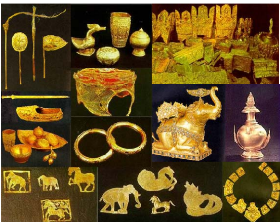
บางส่วนของสมบัติล้ำค่าพบที่กรุวัดราชบูรณะ (ปัจจุบันเก็บรักษาที่พิพิธภัณฑสถานแห่งชาติเจ้าสามพระยา จังหวัดพระนครศรีอยุธยา) อาทิเช่น มงกุฎทองคำด้วยทองคำ

และตะกั่ว) หุ่นจำลองประปรารักษ์วัดราชบูรณะที่ทำด้วยทองคำ พระแก้วทรงเครื่องทอง และสลูปล้างองค์ทำด้วยทองคำประดับอัญมณี