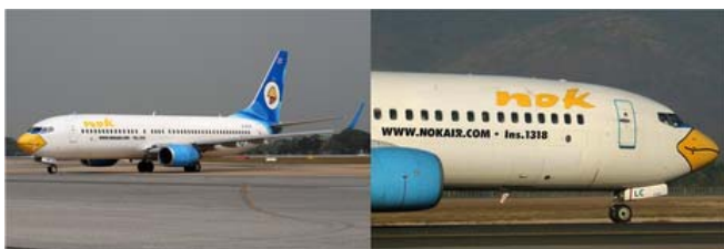
อากาศยานเช่าจากสายการบิน XL ของ

อังกฤษ พร้อมนักบินชาวอังกฤษ ซ้าย B737-8BK-OXLC และขวา B737-8Q8 G-XLAI