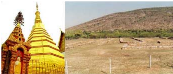
(ซ้าย) พระธาตุช่อแฮยามปกติจะงดงามเช่นนี้

ขอยังให้เป็นเหตุที่คณะในบรรดาอุบาสกผู้เลื่อมใสองค์พระสัมมาสัมพุทธเจ้า เป็นผู้คิดค้นการใช้สมุนไพรรักษาโรคภัยไข้เจ็บ หากเป็นยุคปัจจุบันน่าจะได้รับรางวัลโนเบลหมอชีวภรรตธรรม เป็นพระโศดาบัน และด้วยเห็นว่าพระพุทธรองค์ ต้องประทับอยู่ไกลถึงเวฬุวันวิหาร จึงสร้างวัดถวายในสวนมะม่วงของตน เรียกว่าชีวภัมวัน หรือป่ามะม่วงของหมอชีวภ ๗๗ อยากรู้มากกว่านี้ให้ไปบวชเรียน) และสวมหมวกทรงตะลุ่ม ๑๕. หน้าต่างบานเล็ก ที่มุมด้านหลังขวา ภาพเขียนชัดเจน พื้นด้านล่างปรับปรุงใหม่ ช่องพื้นที่เคยมีรูปเจาะ ถูกแทนที่ด้วยหินแกรนิตเจาะรูขนาดเส้นผ่านศูนย์กลาง ๕-๖ เซนติเมตร เพื่อระบายอากาศได้ถุน (และสามารถระบายน้ำลงไปได้ด้วย) ๒๐ ยูนิต ทัศนศาสตร์อาสาสมัคร ที่ไม่ยอมรับค่าตอบแทน บอกทำเพราะใจรักฝึกฝน เพื่อโตขึ้นจะได้ร่ำเรียนทางศิลปตามที่ใจรัก กว่าจะยอมรับสินน้ำใจจากอาจารย์สองสามท่าน ก็ต้องขอร้องแกมขยี้ดเย็นดหลายรอบ และได้อธิบายเรื่องฝรั่งในภาพว่าเป็นฝรั่งเศส แต่ดูสีธงแล้วแม้จะเป็นแถบสีเดียวกันแต่อยู่สลับตำแหน่ง ซึ่งกลายเป็นธงดช (เนเธอร์แลนด์) แต่มักถูกเทศน์บอกว่า ตามประวัติศาสตร์ช่วงนั้น ไม่ปรากฏชาวดัชเข้ามาที่เมืองน่าน ไว้ผมมีเวลาจะตรวจสอบ